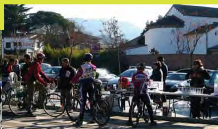
Pedalada per la Marató