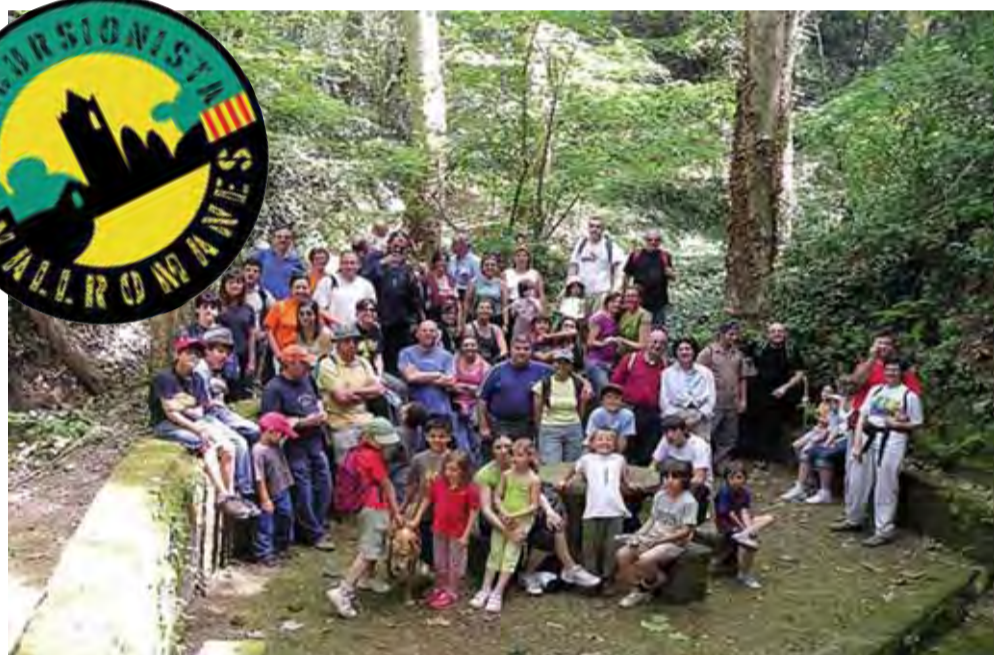
Grup a la Font de Sant Joaquim