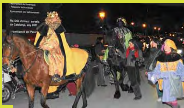
A Vallromanes arriben a cavall