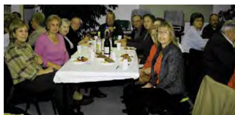
Castanyada al Casal de la Gent Gran