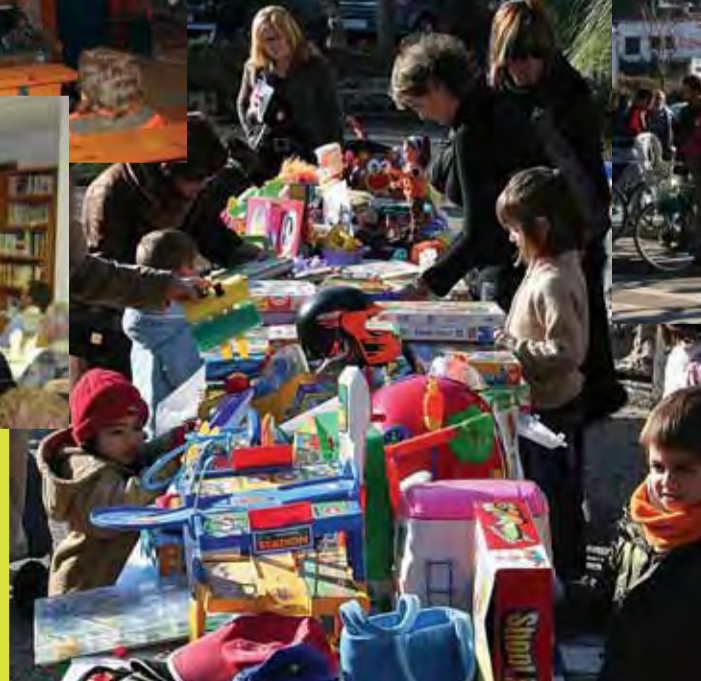
Temps de joguines