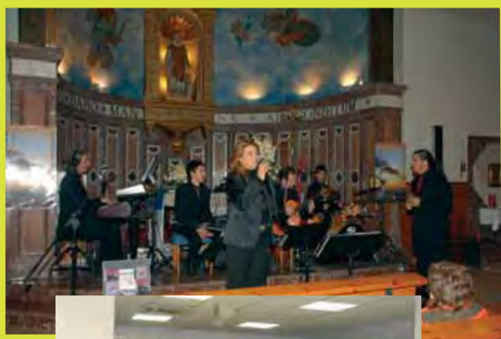
Concert d'Any Nou a la Parroquia