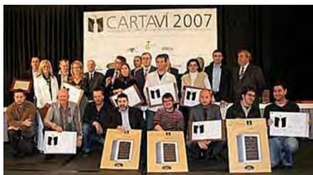
El restaurant Sant Miquel guanya un premi de cartes de vins