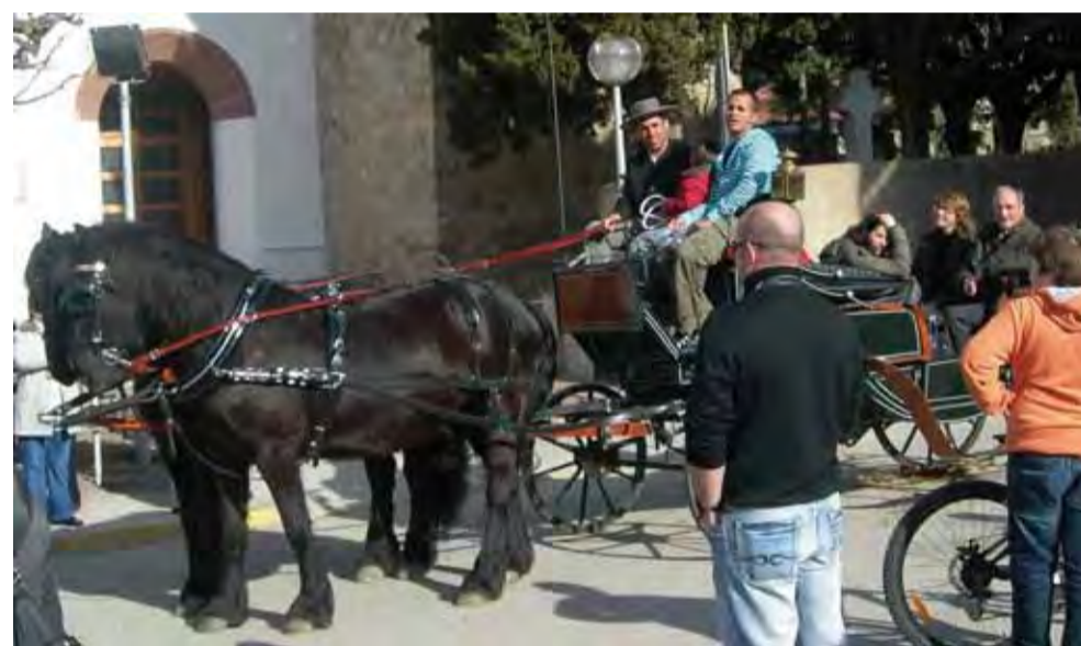
Bonic carruatge!