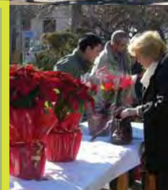
Col·laborant amb la Marató