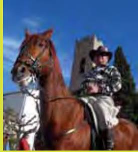
Far West a Vallromanes (foto Xavi Moya)