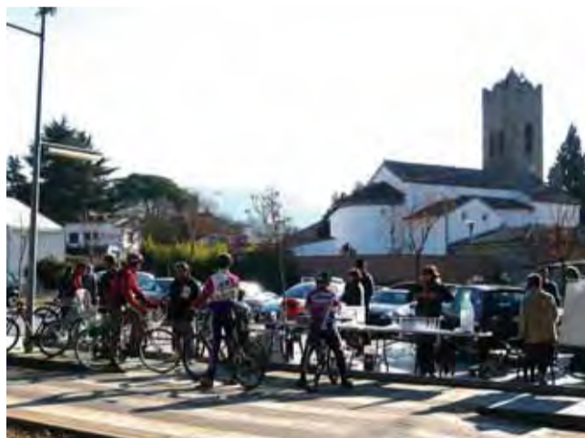
Pedalada per la Marató de TV3