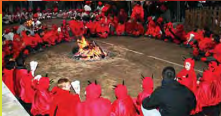
Rotllana de dimonis