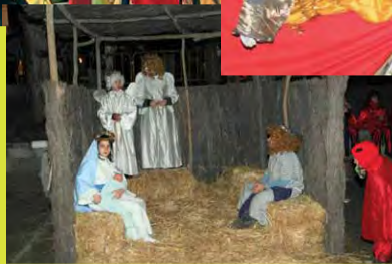
Dimoniet espia el pessebre