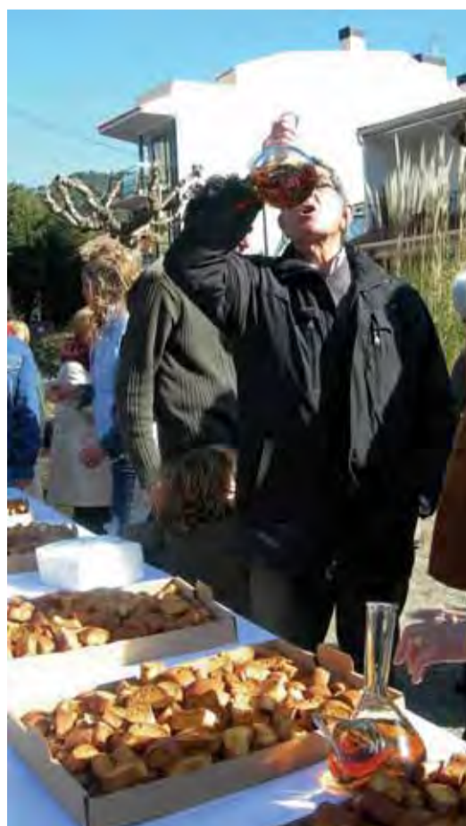
Els típics borregos i el moscatell per Sant Antoni