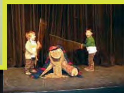
Caga Tió, caga turro...