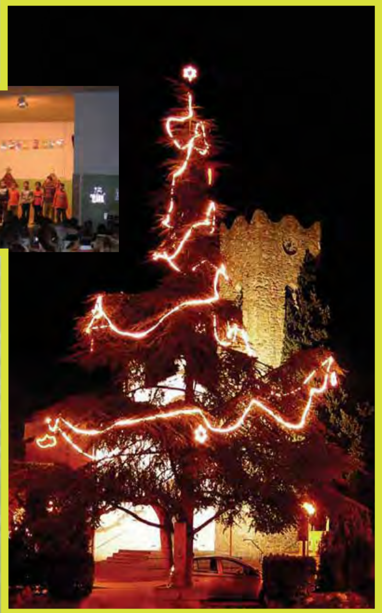
Desembre a la plaça del poble