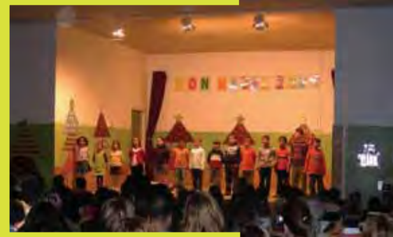
Nadal al Tres Pins

El tradicional Concert d'Any Nou a l'església parroquial de Vallromanes enguany va tenir poca concurrència tot i l'atractiu repertori de nades, sarsuela i música catalana interpretat pel grup Empordà Fusió. Potser el fred i la ressaca de la darrera nit de l'any tingueren la culpa