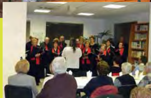
Coral al Casal Gent Gran