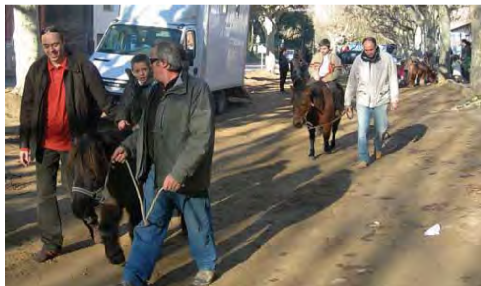
Mati de ponis