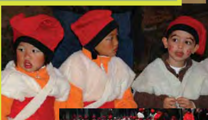
A Betlem me'n vull anar...