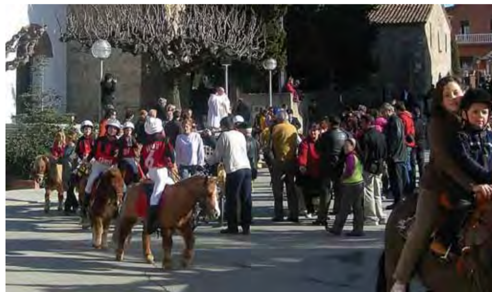
Arri, arri, Tatanot!

Tot va acabar amb uns bons "borregos" i vi bo pel públic assistent, ofert per la Regidoria de Festes i un pica pica pels genets i col·laboradors, gentilesa del Restaurant Montbell, que es va servir al exterior de la Carpa.